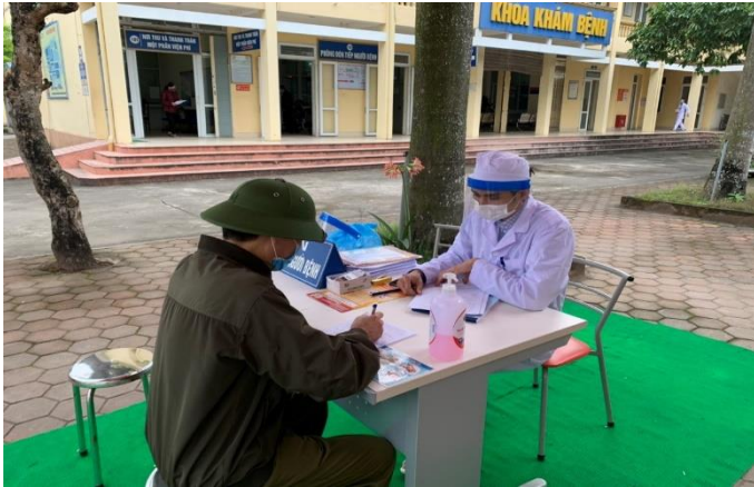
Phân loại, sàng lọc, kê khai y tế đối với người bệnh đến khám bệnh phòng tránh Covid 19