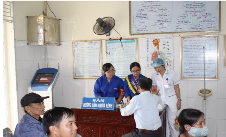
Bàn đón tiếp và hướng dẫn người bệnh