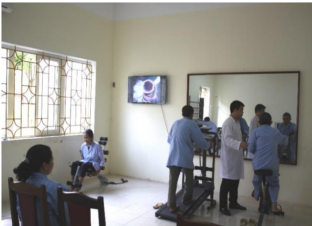
Hướng dẫn người bệnh tập phục hồi chức năng hô hấp