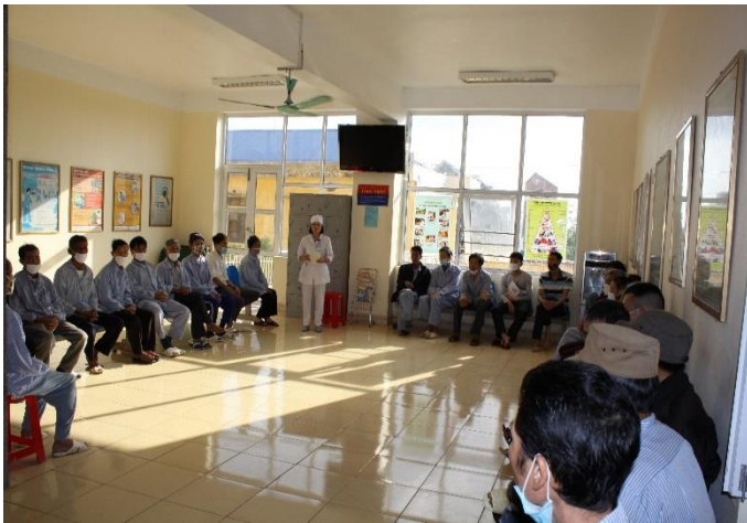
Họp hội đồng người bệnh