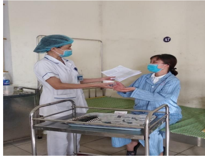
Hướng dẫn người bệnh uống thuốc