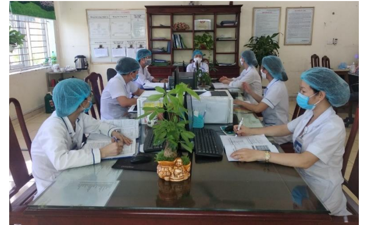
Giao ban triển khai công tác điều dưỡng