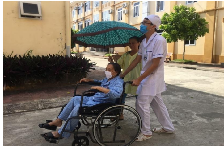
Hỗ trợ người bệnh di chuyển