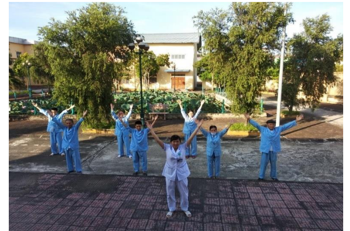
Hướng dẫn người bệnh tập thể dục