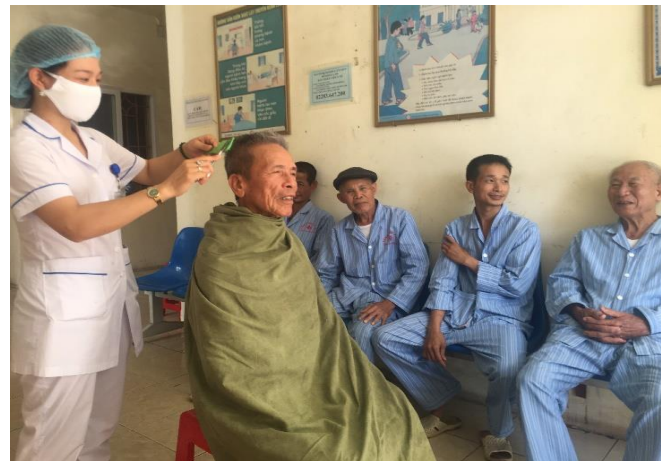
Cắt tóc giúp người bệnh